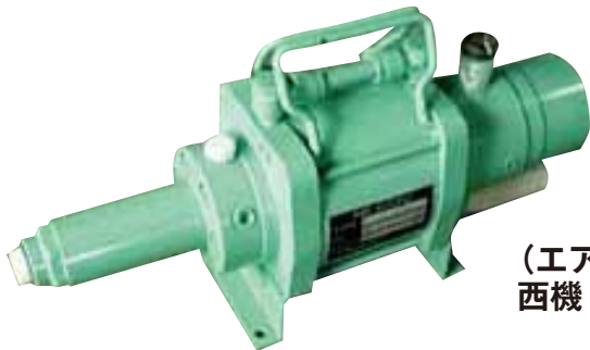
(エア式) 西機 SAH-24-190