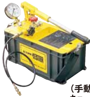
(手動式) キョーワ T-300N