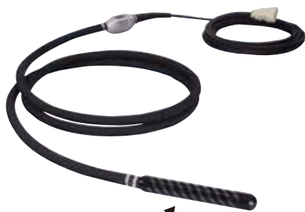
スパイラルリナー