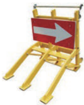
(矢印板はオプションです)