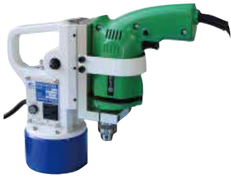
カネテック KCD-MDN2 (電気ドリル付)