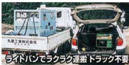
ライトバンでラクラク運搬 トラック不要