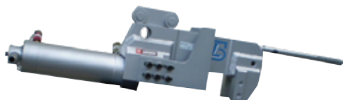
ウォールカッター HWC-2