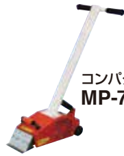
コンパクトペッカー MP-7