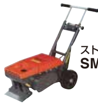
ストロングペッカー SM-18