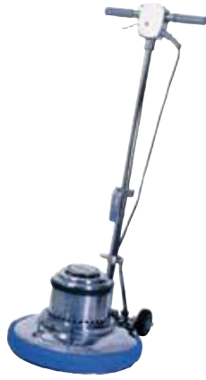
フロアポリシャー CMP-160