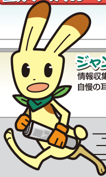
ジヤンピンチ 情報収集力はピカイチ 自慢の耳ですぐにキャッチ