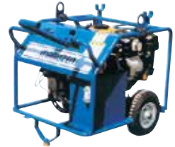
(エンジン式油圧ユニット)