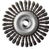
ワイヤーブレード