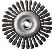
ワイヤーブレード