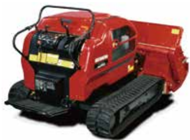
(ハンマーナイフモア装着時) SH1550A