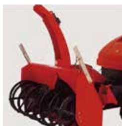
スノーブロフ (SH1550Aのみ)