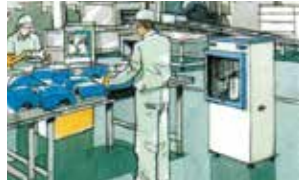
工場や倉庫での作業に