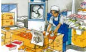
生鮮食料品を扱う店先で