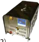
ポンプ本体 (写真はWM1002)