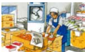
生鮮食料品を扱う店先で