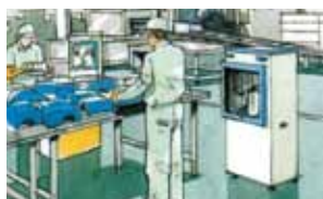
工場や倉庫での作業に