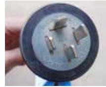
充電用コンセント形状