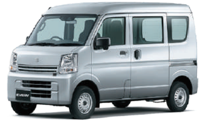
軽四ワンボックス