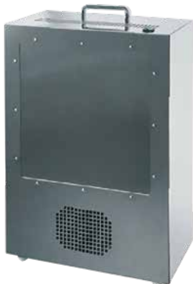
市販の空気清浄機

ラジカルバスターV1は、装置内に吸引した空気に含まれるウイルスや菌類・臭気成分を、酸化チタンと紫外線による光触媒作用で抑制・除去いたします。