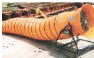
↑ダクト装着時(直進風)