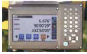
大型ディスプレイ